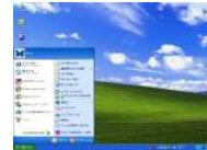
スタートメニューを開いたり